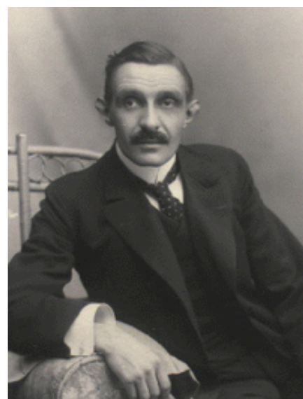
Herman Bang (1857-1912).

Bangs motivval rör sig väsentligen på två helt skilda livsområden. Det ena är de olyckliga, livströtta och sjukliga unga människor, vilka nästan planlöst föras ikring ute i det febrila och fordrande världslivet. Det andra är en del livets styvbarn, som har sin undangömda och obetydliga tillvaro i skumma och trånga vrår. Jämte stämningar av fatalistisk tyngd och nervös ängslan, ger han med förkärlek smålustiga och sympatiskt humoristiska genretavlor. Han har utbildat en stil, som med allt sitt manér äger stora förtjänster genom känslighet och skärpa. Där har talspråkets egenskap att återge ögonblickets liv utvecklats till en impressionistisk, litterär stil av stor intensitet.